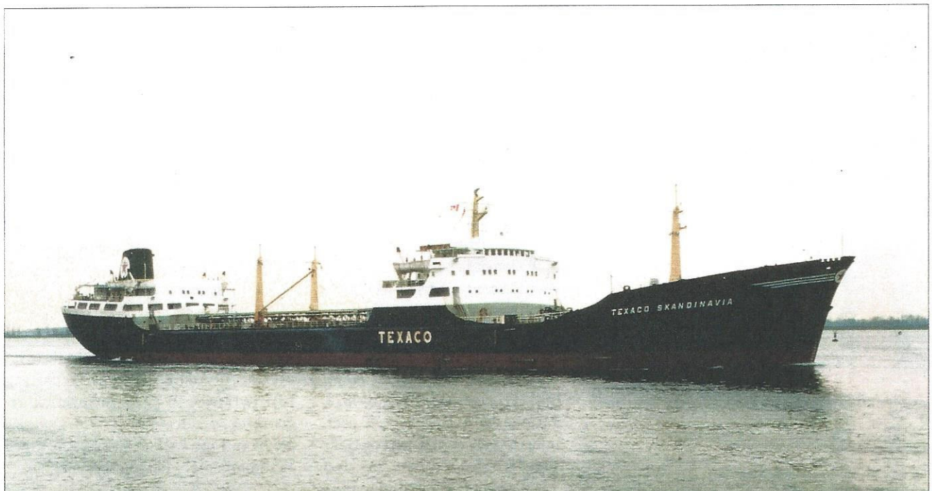
Det sier sitt om rederiet Texaco Norway at samme skip i mai 1976 tok seg så bra ut.