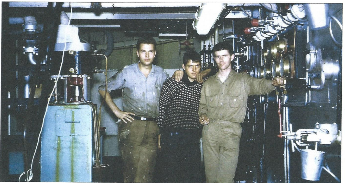
Gutta på maskindørken. Forfatteren til høyre. (SETT BAKFRA!)