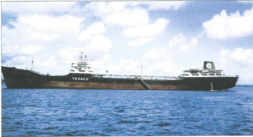
Selv tankskip hadde vakre linjer i 1962; Texaco Skandinavia for anker ved Pointe à Pierre.