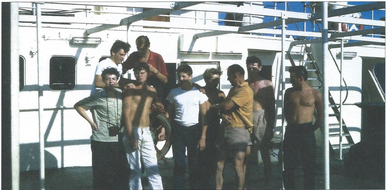
Noen av mannskapet på Texaco Skandinavias første reise.