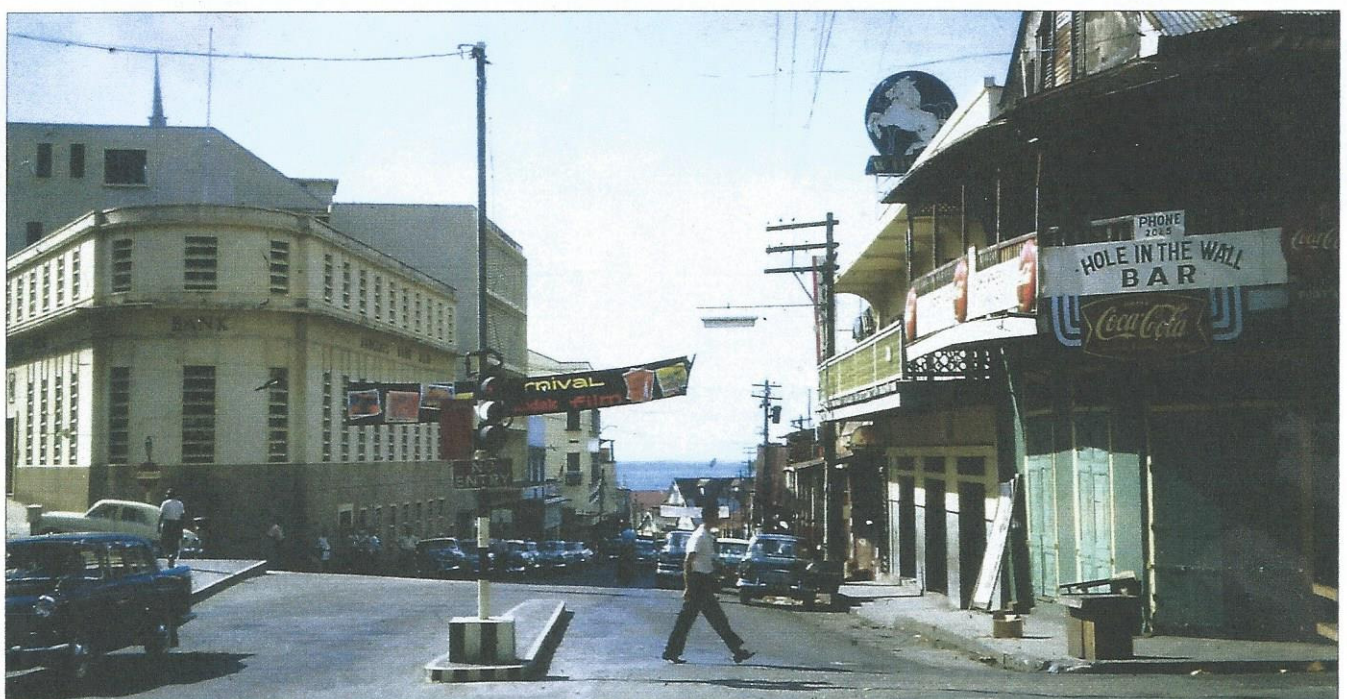
Slik var «streeten» på Point à Pierre, Trinidad; en ensidig underholdningstilbud.

Dette var vårt første møte og det ble mange siden. Har lest et minneskrift over