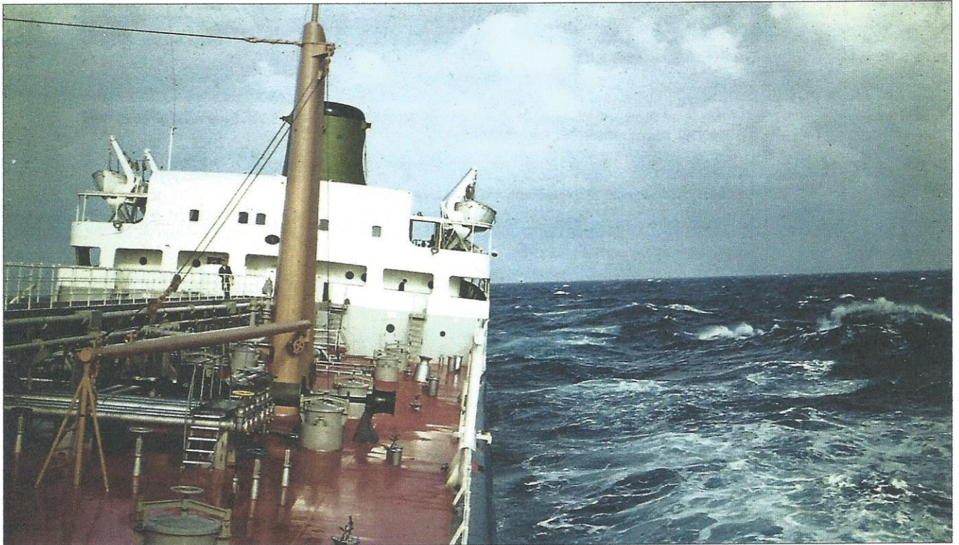
Texaco Skandinavia underveis; et nytt og moderne tankskip på jomfrutur i 1962.